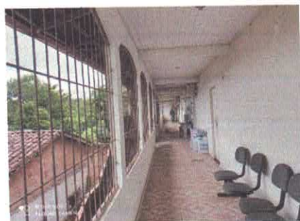
Figura 4: Corredor de acesso lateral.