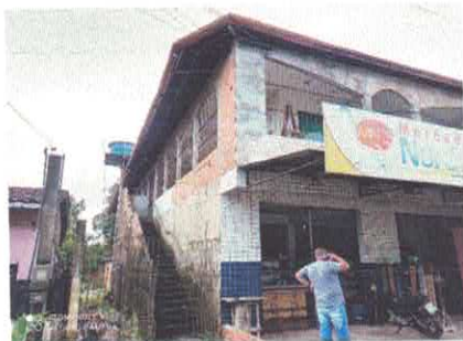
Figura 2: Fachada do imóvel.

A seguir, imagens atuais do imóvel em análise: