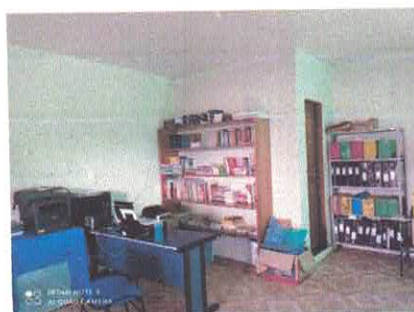
Figura 5: Ambiente interno.