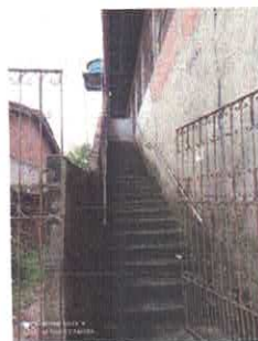
Figura 3: Escadaria de acesso ao imóvel.