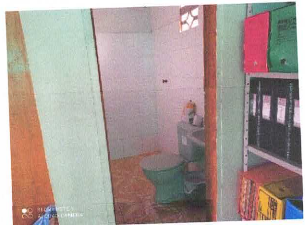
Figura 6: Banheiro