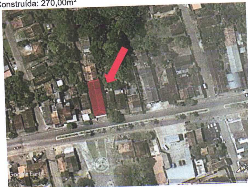
Figura 1: Imagem aérea da localização do imóvel.