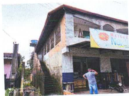
Figura 2: Fachada do imóvel.

A seguir, imagens atuais do imóvel em análise: