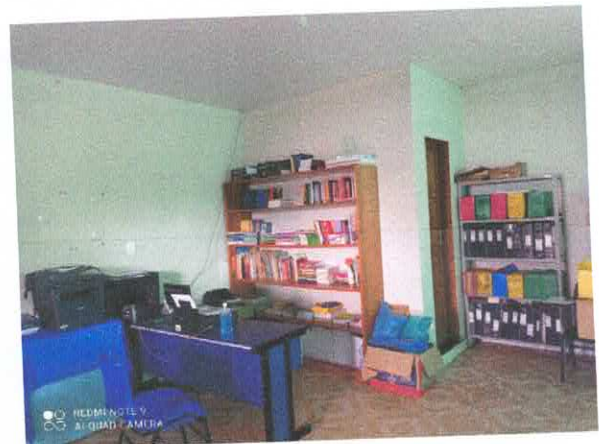
Figura 4: Área técnica