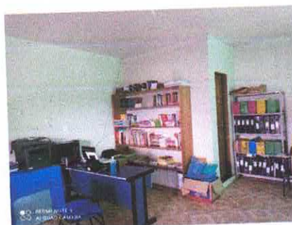
Figura 5: Ambiente interno.