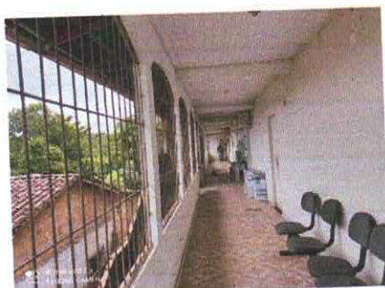
Figura 4: Corredor de acesso lateral.