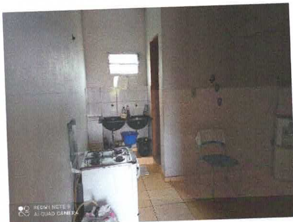
Figura 5: Cozinha