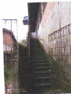
Figura 3: Escadaria de acesso ao imóvel.