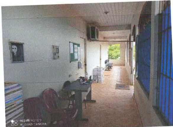
Figura 1: Recepção/ circulação

Este relatório fotográfico tem por finalidade demonstrar o interior do imóvel avaliado. Seguem as imagens: