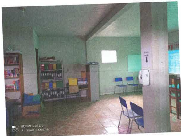
Figura 3: Área técnica