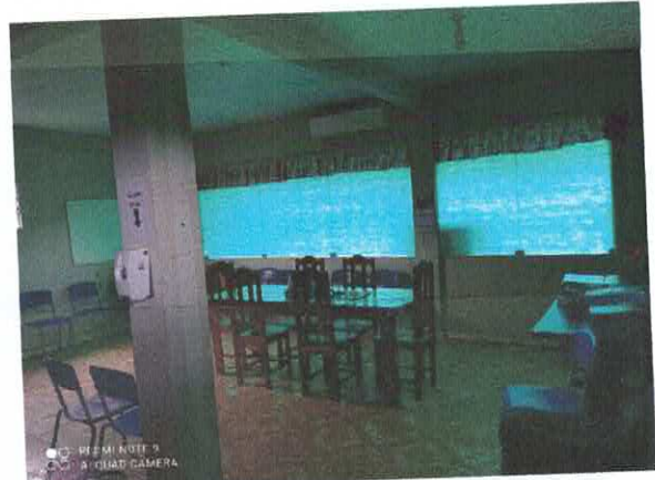
Figura 2: Área técnica